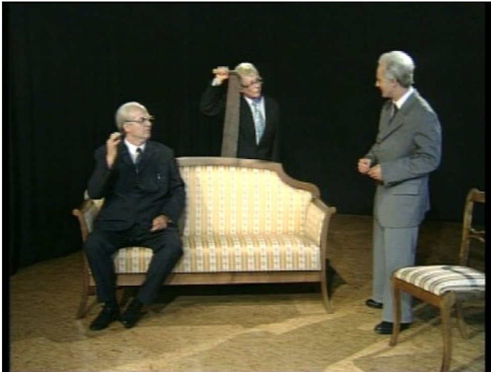
Kanzler Kohl (BRD), sein Minister (mit Säge), Ministerpräsident Modrow (DDR)